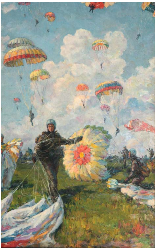
Mihail Petric. Parașutiștii , u/p, 1971. Din colecțiile MNAM

Deși s-a acordat o importanță metodologică majoră contextualizării obiectului de studiu, suprasarcina acestei istorii s-a pretat unor reabilitări antropocentrice, reamplasând istoria cinematografică în circuitul firesc al istoriei artei cu caracterul ei preponderent filozofico-estetic. Criteriile artistice substituind cele ideologice, s-a purces la o reevaluare a trecutului istoric prin intermediul racursului „artist-putere”, de primă importanță pentru evoluția culturii într-un stat totalitar. Astfel, dramele creației, invadând paginile acestui volum, s-au cristalizat în mici psihobiografii, volumul dezvăluind complexe stări de spirit ale artistului bântuit de „teroarea istoriei” sovietice. Aspectele socio-psihologice, uneori psihanalitice, au consolidat ideea inițială de a suprapune istoria artei cu cea a istoriei destinelor umane, fascinantă prin surprinderea unor stări de